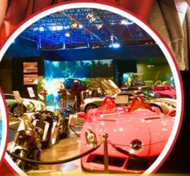
Royal Automobile Museum