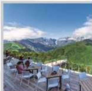
“HAKUBA MOUNTAIN HARBOR”

นำท่านไปไอบกอดธรรมชาติที่ครบครันในที่เดียว “คามิโคจิ” สวิสเซอร์แลนด์แดนญี่ปุ่นเทือกเขาที่ปกคลุมด้วยหิมะสวยงาม ชมความงามของ “ทุ่งพืชมอส ฟุจิชิบะซากุระ” มนต์เสน่ห์..พรมธรรมชาติสีชมพูหลากหลายสีสันสวยสดใส เปลี่ยนอิริยาบถ “ขึ้นกระเช้าฮาคุบะ อิวะตะเกะ” เพื่อชมวิวพาโนรามาของเทือกเขาแอลป์ญี่ปุ่นกันให้อิ่มใจ สัมผัสกลิ่นอายเมืองเก่า “เมืองทาคายามา” ที่ยังคงอนุรักษ์ความเป็นอยู่ เมื่อสมัยเอโดะกว่า 300 ปี สายช้อปปิ้งห้ามพลาด “คารุอิซาวะ เอ้าท์เล็ต” แลนด์มาร์กของเมืองคารุอิซาวะ และ “ย่านชินจุกุ” แห่งเมืองโตเกียว ชมความงามกับเส้นทาง “เจแปนแอลป์ (ท่าแพงหิมะ)” สุดยอดของการท่องเที่ยวที่ถูกขนานนามว่า “หลังคาแห่งญี่ปุ่น”