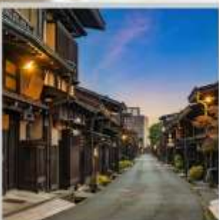
“TAKAYAMA OLD TOWN”