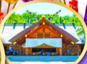
ศาลเจ้าออกโทโด