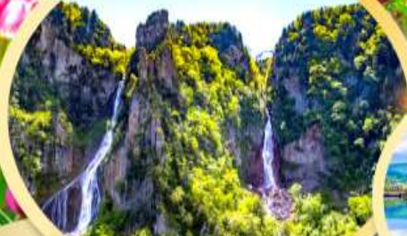
น้ำตกกิ่งกะ-น้ำตกริวเซ