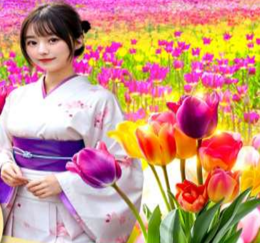
ชมทุ่งดอกชิบะ