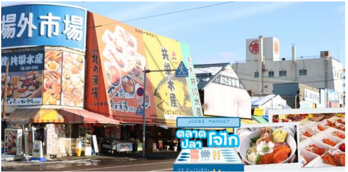
กลางวัน อีระอาหารกลางวันตามอริยาศัย ณ ตลาดปลาโจโกะ