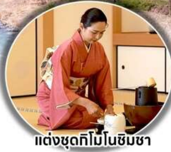
แต่งชุดกิโมโนชิมชา