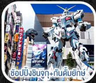
ช้อปปิ้งชินจูกุ+กันดั้มยักษ์