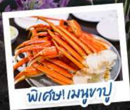
พิเศษ! เมฆหามู