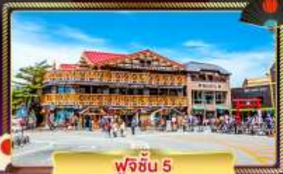
ฟุจิชั้น 5