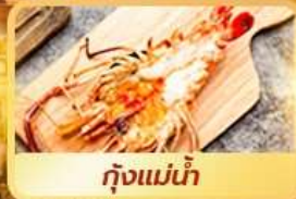
กุ้งแม่น้ำ