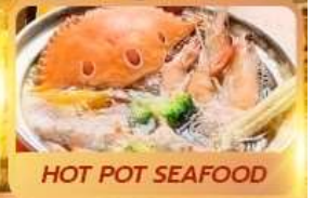
HOT POT SEAFOOD