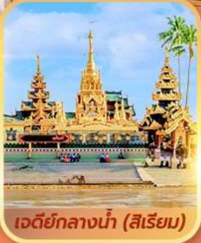
เจดีย์กลางน้ำ (สิริเยม)