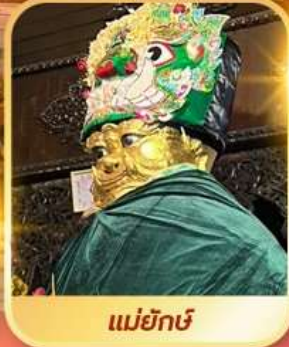
แม่ยักษ์