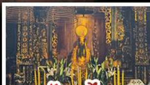
วัดกวนไท้