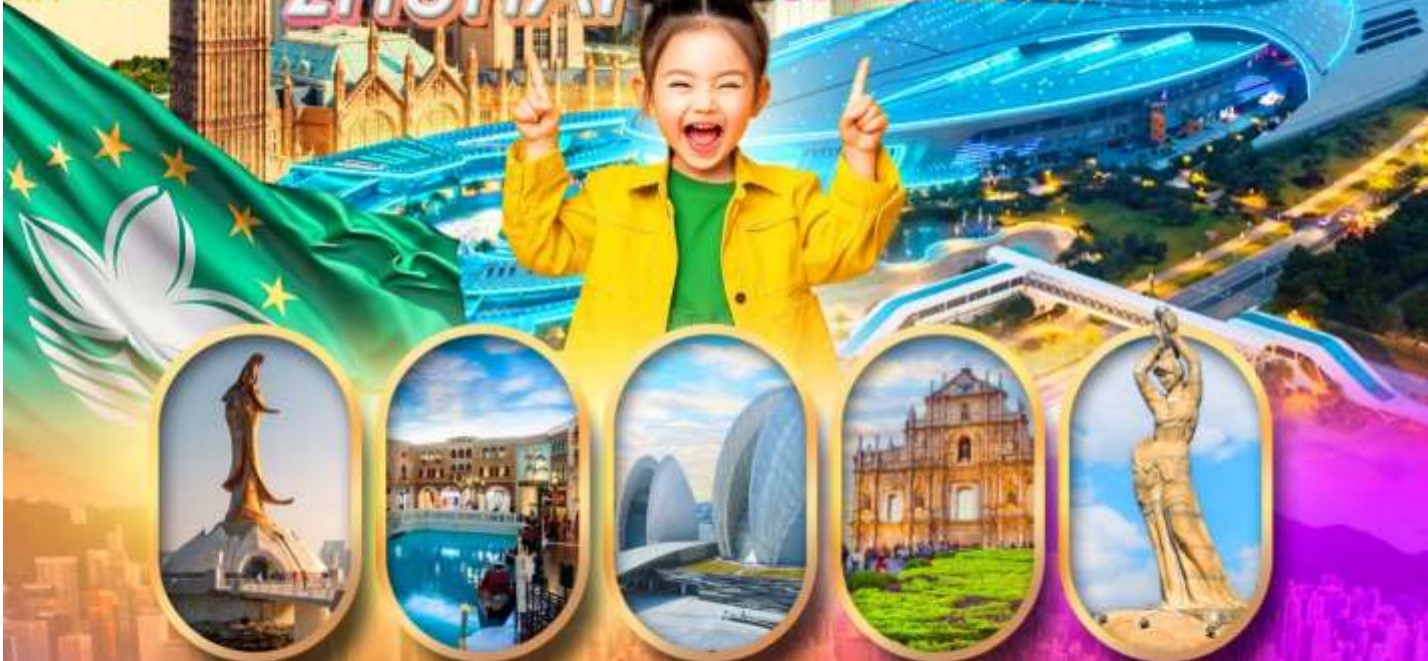
เจ้าแม่ทวนอิมริมทะเล