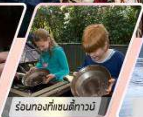
ร้อนทงที่แซนดี้ทาวน์