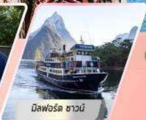
มิสฟอร์ด ซาวน์