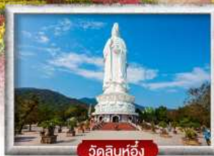
วัดลินห์ฮื่อง