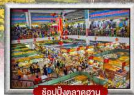
ซอปปิงตลาดฮาน