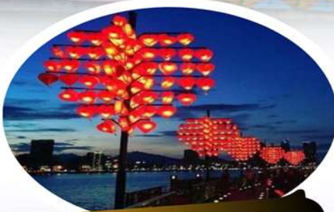
สะพานแห่งความรัก