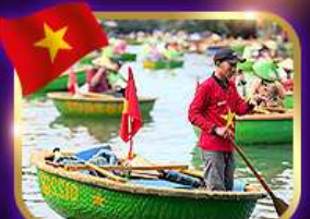
เรือกระด้ง หมู่บ้านก๊อบกาน