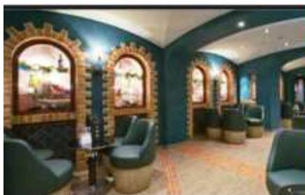
LA CANTINA DI BACCO