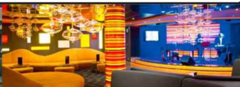
GOLDEN JAZZ BAR