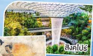
สิงคโปร์