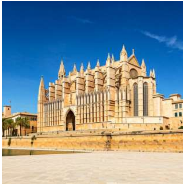
Palma de Mallorca:

Catedral de Mallorca: มหาวิหารปาล์มา เด มาจอร์กา สถาปัตยกรรมโกธิคที่สวยงามตระการตา ภายในมีกระจกสีสวยงามและโคมไฟระย้าขนาดใหญ่