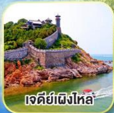
เจดีย์เฝิงไหล