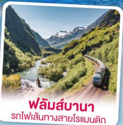
พลัมส์บานา รถไฟเส้นทางสายโรเมนติก