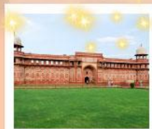
Ajmer Sharif Dargah