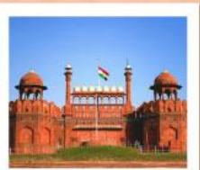
♥♦♦ Agra Fort