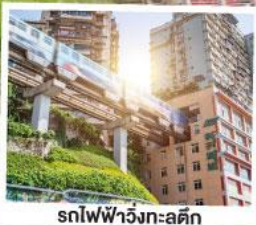
รถไฟฟ้าวังเกอตุ๊ก