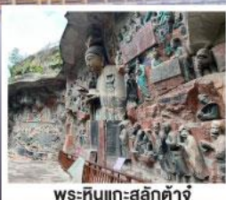
พระหินแกะสลักตัวจู้