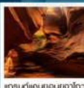
แกรนด์แคนยอนบูดาโกว