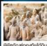
พิพิธภัณฑ์กองทัพใต้ดิน

ทัวร์คุณภาพ ไม่ลงร้านช้อปปิ้ง ไม่ขายออฟชั่น