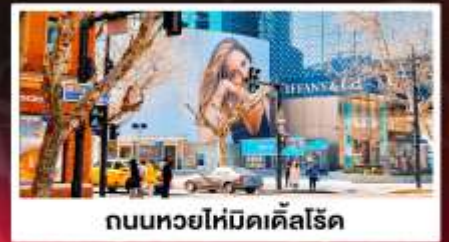
ถนนหยอไห่มีดเคิลโรด