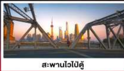
สะพานไวปู้ตู่