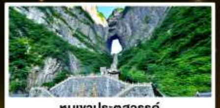
ทิวเขาประตูสวรรค์