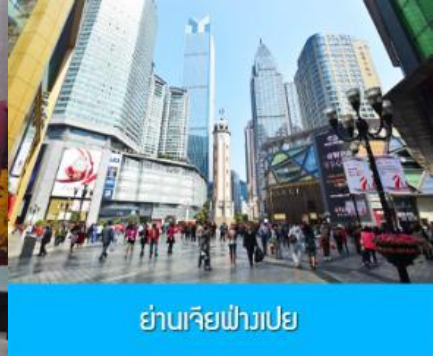
ย่านเจียฟางเปย