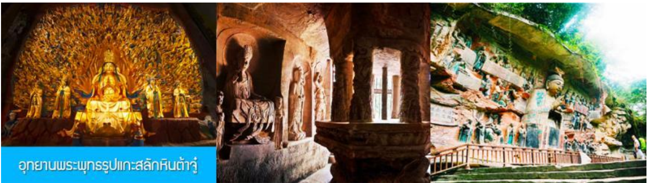
อุทยานพระพุทธรูปแกะสลักหินต้าจู่