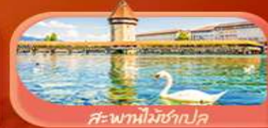
สะพานไมซ์าป

Highlight เยือนหมู่บ้านแสนสวยเซอร์แมท เช็กอินศาลาไทยสุดงามที่โลซาน เที่ยวลูเซิร์น ชมสะพานไม้ชาเปลและอนุสาวรีย์สิงโต ซาลี แอปสึน ชมประติมากรรม The Fork และปราสาทซิลลองริมทะเลสาบ เยือนมิลาน มหาวิหารดูโอโม ที่เวโรนา เมืองลอยน้ำสุดโรแมนติก อินกับรักอมตะที่บ้านจูเลียต และช้อปปิ้งจุใจที่ Serravalle Outlet