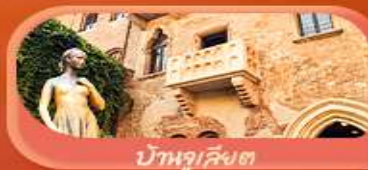
บ้านจูเลียต