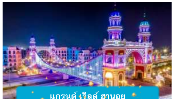
แกรนด์ เวิลด์ ฮานอย