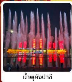
น้ำพุคังปาสี

• โอโลกั เป็นทรายสีขาวหวาน แหล่งท่องเที่ยวระดับ 5A ของจีน ภูเขาไฟอูลันฮาตา น้ำพุคังปาสี น้ำพุที่สูงที่สุดในเอเชีย