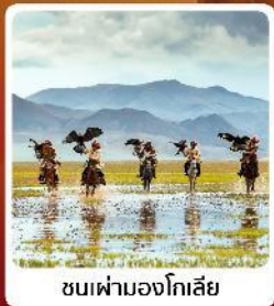
ชนเผ่ามองโกเลีย