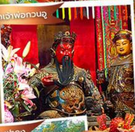
วัดหลินพาทง