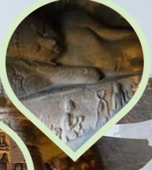
นั่งชมถ้ำพระพุทธศาสนา เทวสถานอชันต้า