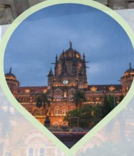
ชม Victoria Terminus สถาปัตยกรรมไฟประวัติศาสตร์และเป็นมรดกโลกของยูเนสโก