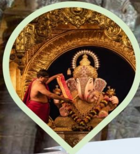
สักการะองค์พระพิฆเนศวร ศักดิ์สิทธิ์ประจำเมืองมุมไบ และปูणे