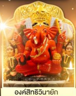
องค์สิทธีวินายก