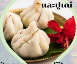
รับชุดสักการะฟรี! ม่านและ 1 ชุด