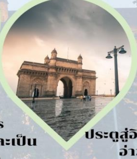
ประตูสู่อินเดีย (Gateway of India) อ่าวมุมไบ Arabian Sea India