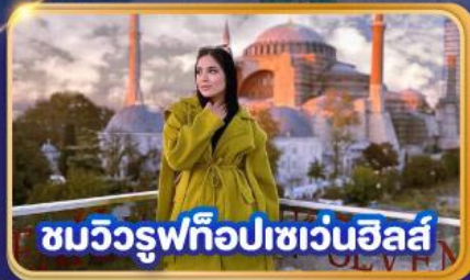
ชมวิวยุฟทือปเซเวนฮิลส์