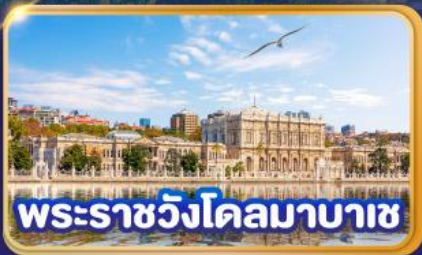
พระราชวังโคลมาบาซ