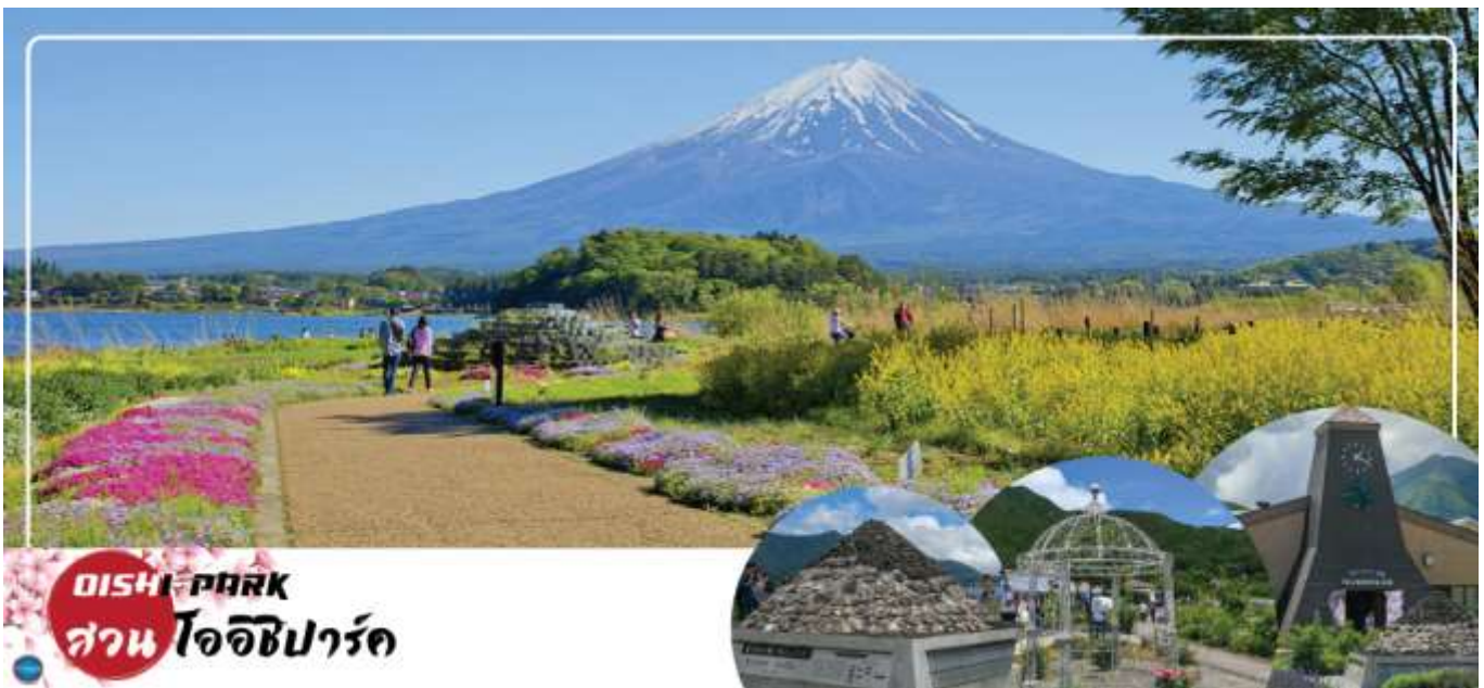
OISHI PARK สวน โออิชิพาร์ค

วันที่สาม จังหวัดยามานาชิ – สวนสาธารณะโออิชิ – พิพิธภัณฑ์ญี่ปุ่น – โกเทมบะพรีเมียมเอาท์เล็ต – เมืองนาริตะ – อีออน มอลล์ นาริตะ