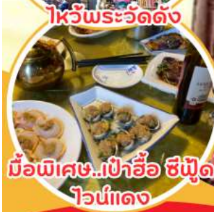
มือพิเศษ...เป่าอ้อ ซิฟู๊ด ไวน์แดง