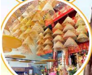
ไหว้พระวัดดัง