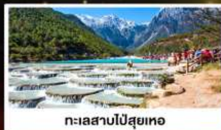
ทะเลสาบไป๋สฺยฺเหอ