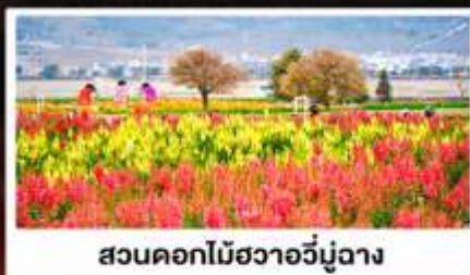
สวนดอกไม้ฮวาอวี๋มู่ฉาง