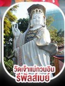
วัดเจ้าแม่กวนอิม ริฟลส์เบย์