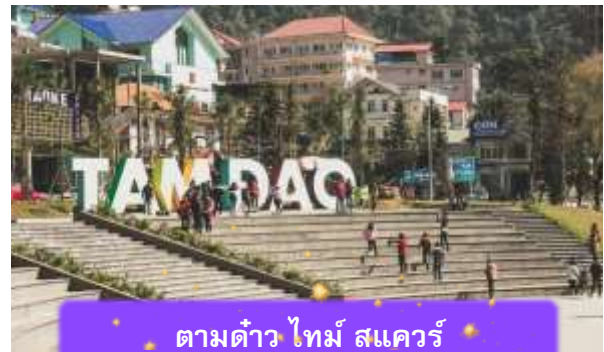
ตามด้าว ไทม์ สแควร์

เช็คอิน ตามด้าว ไทม์ สแควร์ ที่นี่เป็นฟิลสวอนสาธารณะกลางเมือง เป็นพื้นที่ที่ชาวตามด้าวใช้พักผ่อนกันเป็นลานน้ำพุกว้าง ๆ ที่มองเห็นเมืองโดยรอบ ซึ่งรอบๆจัตุรัสนี้ก็จะมีร้านค้า คาเฟ่ ร้านอาหาร และมีมุมถ่ายรูปน่ารักๆ เหมาะสำหรับการถ่ายรูป นำท่านเดินทางกลับ เมืองฮานอย