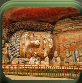
“ พาหินแเกาะสลักต้าจู้ ”

T2G-CKG26CZ Special of Chongqing...วงซิ่ง ต้าจู้ อุ้หลง อุทยานหลุมฟ้า เขานางฟ้า 5D 3N (CZ)