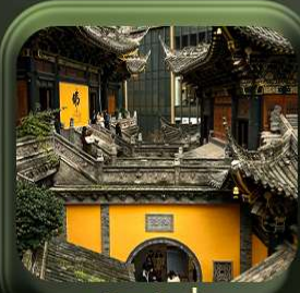
“ วัดหลัวอัน ”