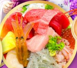
ตลาดปลาฮิมสุ คาชิโนะอิชิ