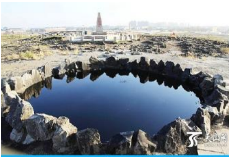
บ่อน้ำมันสีดำ

ระหว่างทางแวะรับประทานอาหารกลางวัน ณ ภัตตาคาร (เมนูอาหาร 80 หยวน/หัว) (11)