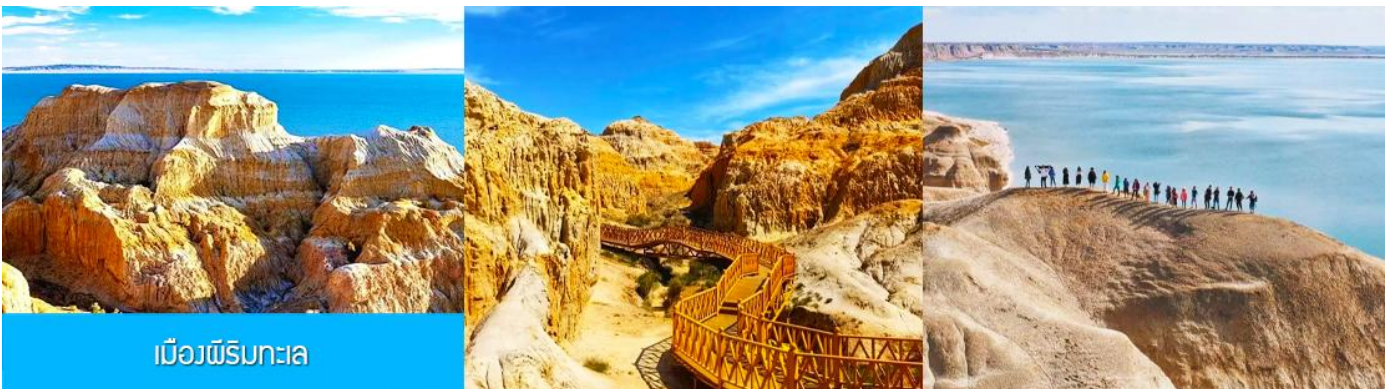
เมืองผีริมทะเล

รับประทานอาหารกลางวัน ณ ภัตตาคาร (เมนูอาหาร 80 หยวน/หัว) (2)