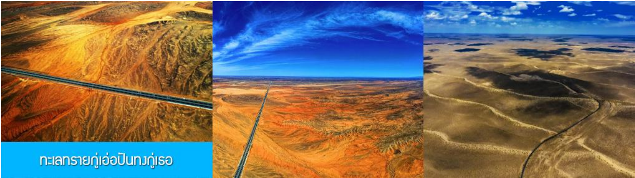
ทะเลทรายกู๋เอ๋อปีนทงกู๋เอ๋อ