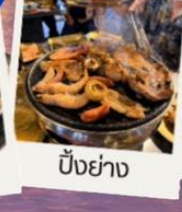
ปิ้งย่าง