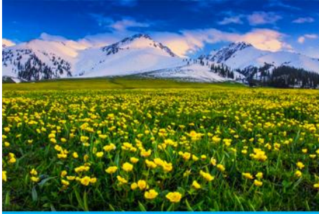
ทุ่งหญ้าลวยฟ้านาลาถิ

พักที่ WAN SEN HOTEL ระดับ 4 ดาวท้องถิ่นในตำบลนาลาถิ