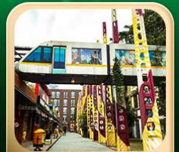
“ตงเจียวจื่อ”