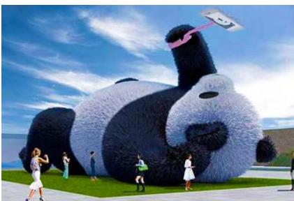
ตุ๊กตาแพนด้าเชลฟี

ระหว่างเดินทางท่านสามารถชมทัศนียภาพธรรมชาติอันงดงามของสองข้างถนนขณะที่รถแล่นผ่าน ที่มีทั้งภูเขาหิมะสูง หุบเขา ธารน้ำ และทุ่งหญ้าบนที่ราบสูง หรือพักผ่อนตามอัธยาศัยบนรถระหว่างเดินทาง