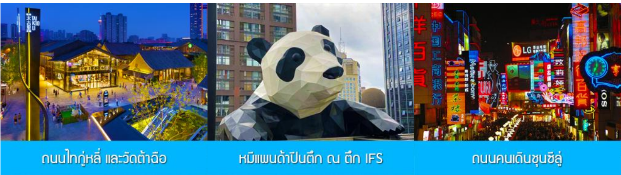
ถนนไท่กู๋หลี่ และวัดต้าเจี๊อ