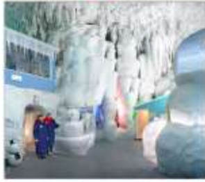
พิพิธภัณฑ์น้ำแข็ง