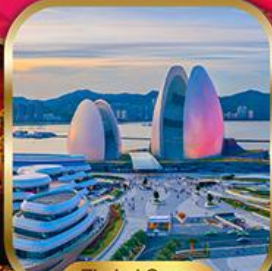
Zhuhai Opera House