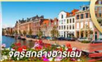
จัตุรัสกลางฮาร์เล็ม