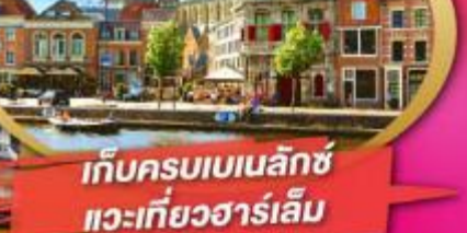
เก็บครบเบเนลักซ์ แวะเที่ยวฮาร์เล็ม