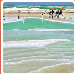
ทะเลสาบเกลือจาเอ้อหาน