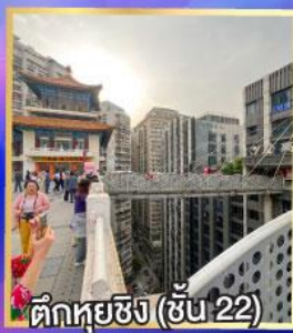
ตึกหุ่ยซิง (ชั้น 22)