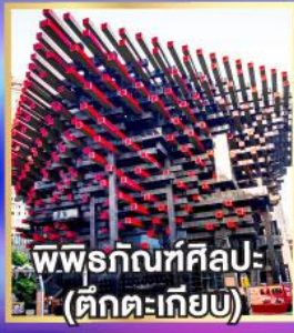
พิพิธภัณฑ์ศิลปะ: (ตึกตะเกียบ)