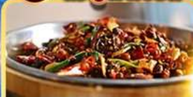
อาหารเสฉวน