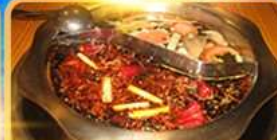
สุกี้ท้องถิ่น