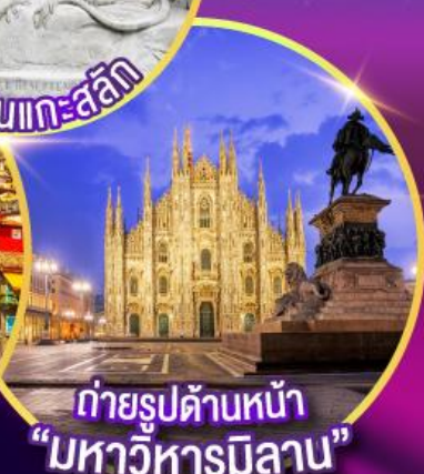
ถ่ายรูปด้านหน้า "มหาวิหารมิลาน"