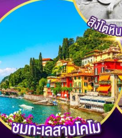
ชมทะเลสาบโคโม