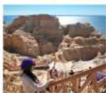
เขตมิกางทะเล